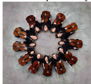
Celliștii Filarmonicii din Berlin